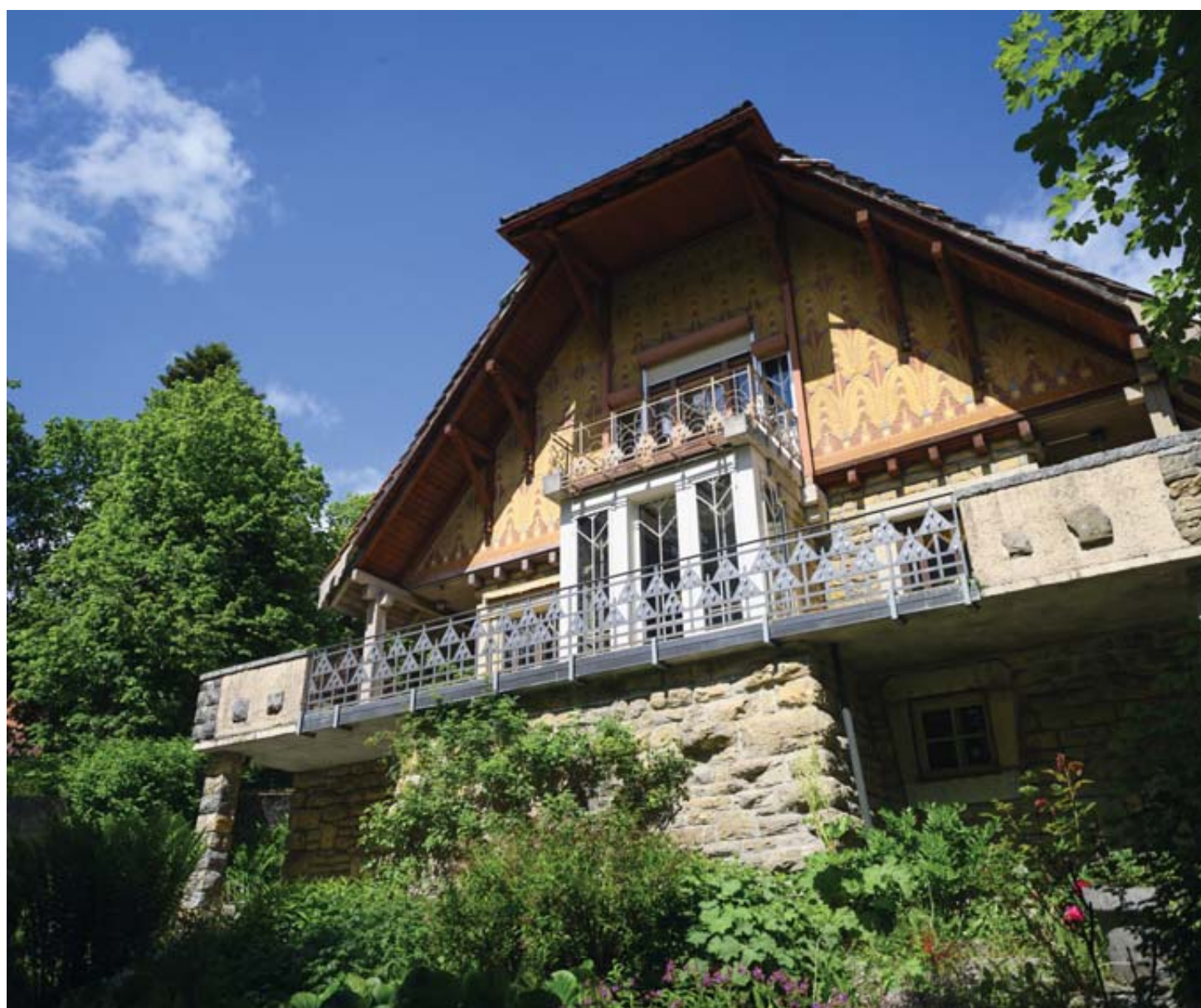
Bâtie au cœur de la forêt, la villa Fallet s'apprête à recevoir le public, qui pourra découvrir son Style sapin si particulier.

Après les fleurs, l'Art nouveau. La Fête de l'urbanisme horloger, qui marque l'anniversaire de l'inscription de La Chaux-de-Fonds et du Locle au patrimoine de l'Unesco, fera la part belle au Style sapin. A cette occasion, plusieurs lieux emblématiques du patrimoine architectural des Montagnes neuchâteloises ouvriront leurs portes aux visiteurs du 24 au 26 juin.