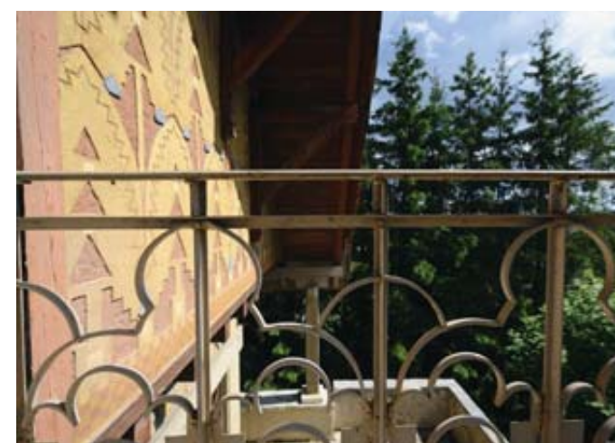
Au premier étage, le balcon permet d'admirer les ferronneries ainsi qu'une fresque en relief, à nouveau caractéristique du Style sapin.