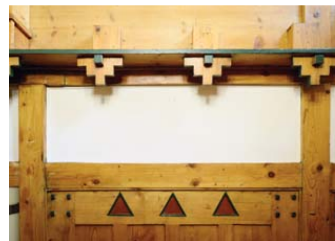
Le Style sapin sous deux formes différentes. En haut, une apparence presque pixelisée, cubique. En bas, le triangle simple qui rappelle tout de suite le conifère.