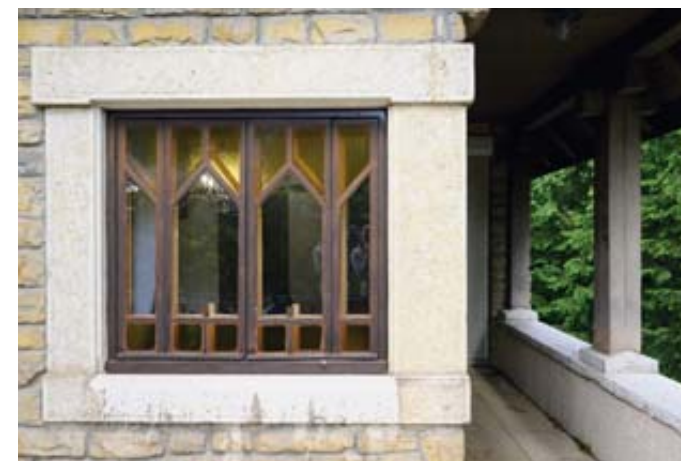
Au rez-de-chaussée, la terrasse circulaire permet presque de faire le tour de la villa.

Programme détaillé de la Fête de l'urbanisme horloger, du 24 au 26 juin à La Chaux-de-Fonds et au Locle: http://urbanisme-horloger.ch